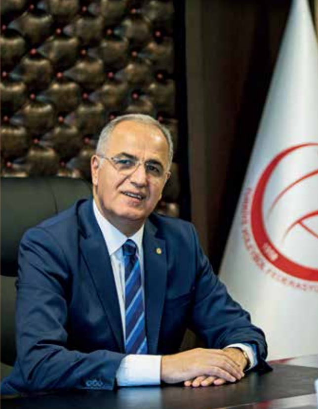
Mehmet Akif Üstündağ Türkiye Voleybol Federasyonu Başkanı

Değerli Voleybol Ailesi, Türk voleybolu için başarılarla geçen 2018 yılını geride bırakıyoruz. Tüm bileşenleri ile voleybol ailesi, bu sene içerisinde elde ettiği başarılarla Türkiye'nin en başarılı branşı olma özelliğini perçinledi.