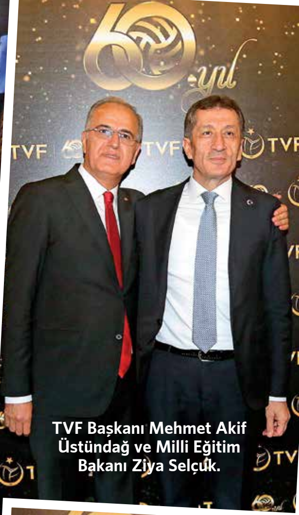
TVF Başkanı Mehmet Akif Üstündağ ve Milli Eğitim Bakanı Ziya Selçuk.