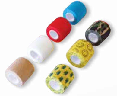
KENDİNDEN YAPIŞKANLI BANDAHLAR