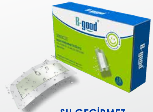
SU GEÇİRMEZ YARA ÖRTÜLERİ