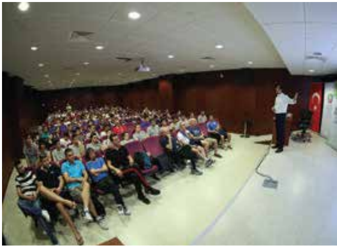
Festival Voleybol süresince antrenör ve sporculara doping, beslenme, kondisyon, temel teknik eğitim gibi konularda ücretsiz seminerler veriliyor.