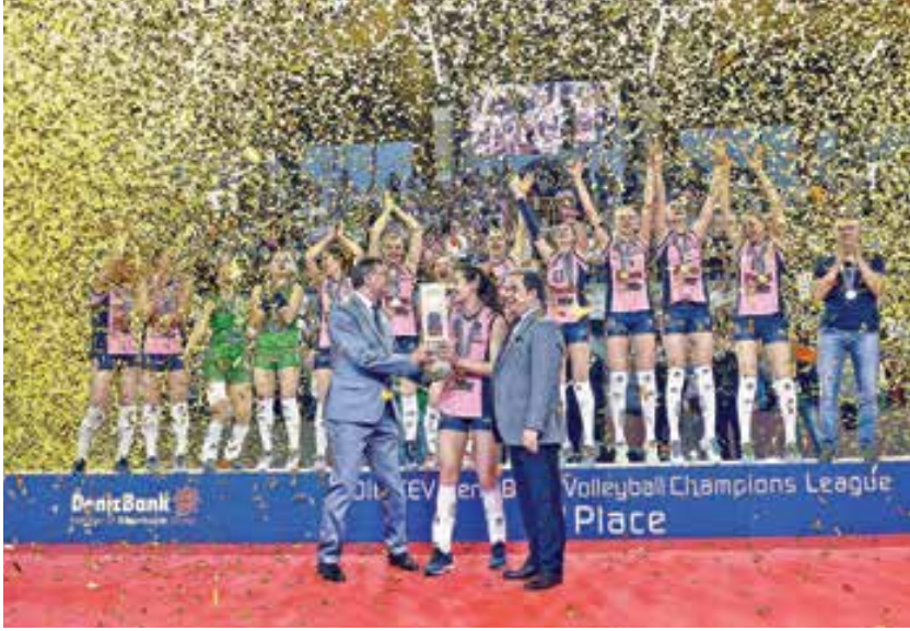
İtalyan Pomi Cassalmaggiore, tarihinde ilk kez katıldığı Şampiyonlar Ligi'nde zirveye çıktı.

Son yıllarda Türk takımlarının damga vurduğu CEV DenizBank Bayanlar Şampiyonlar Ligi'nde temsilcilerimiz VakıfBank ve Fenerbahçe Grundig kürsüye çıkmayı başardı.