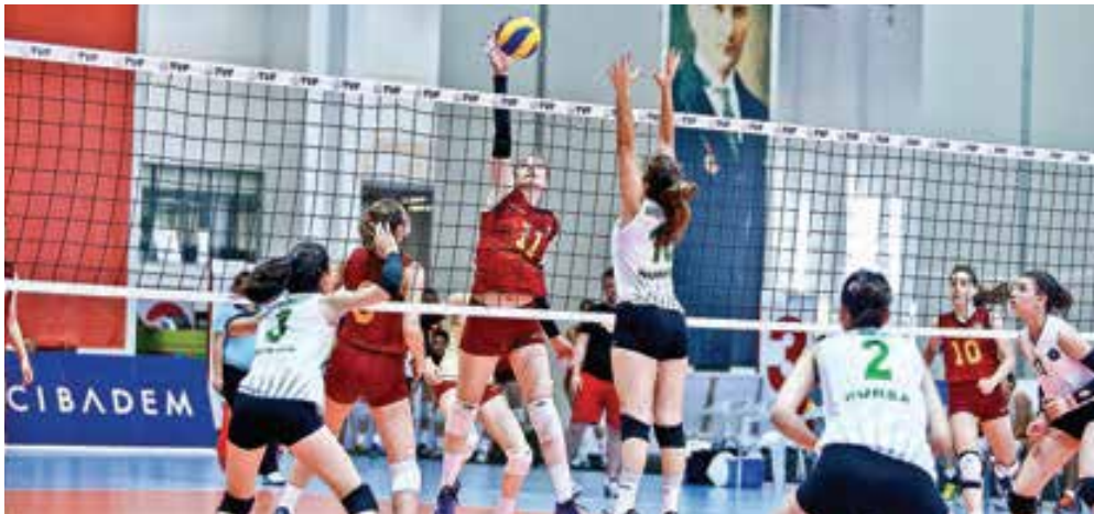
Galatasaray ile Bursa Büyükşehir Bld. 5.-8. klasman maçında karşı karşıya geldi.

Yıldız Kızlar yarı finallerinde ise Fenerbahçe ile İlbank, Bahçelievler Bld. ile de Eczacıbaşı kozlarını paylaştı. İlbank yarı finalde Fenerbahçe'yi 3-1 yendikten sonra, finalde de Eczacıbaşı'nı 3-0'la (25-20, 25-14, 25-22) geçerek altın madalyaya uzandı. Tie break'in ardından Fenerbahçe'yi mağlup eden İstanbul Bahçelievler Bld. ise bronz madalyayı boynuna taktı.