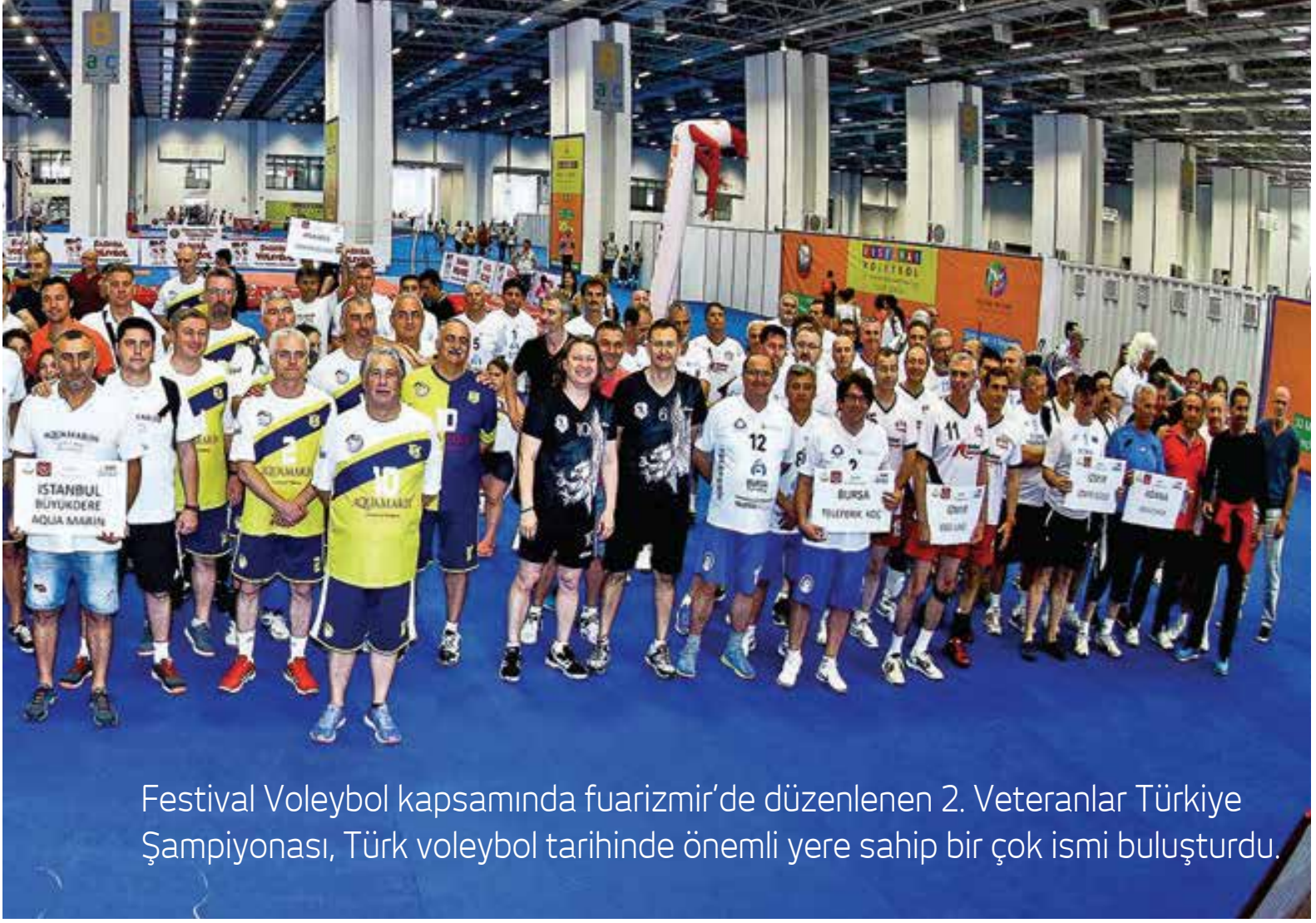
Festival Voleybol kapsamında fuarizmir’de düzenlenen 2. Veteranlar Türkiye Şampiyonası, Türk voleybol tarihinde önemli yere sahip bir çok ismi buluşturdu.