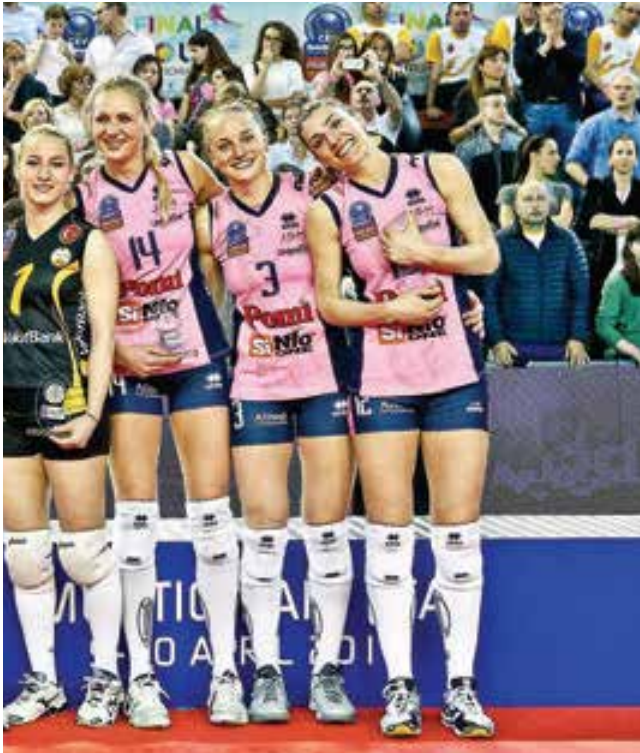
Fenerbahçe Grundig ve VakıfBank'tan dört sporcu, turnuvanın en iyi altısı içinde yer almayı başardı.

VakıfBank ile Pomi Casalmaggiore arasında oynanan final mücadelesi ise nefesleri kesti. Tüm setlerin yakın skorlarla sonuçlandığı mücadelede küçük nüanslar kazananı belirlerken, ev sahibi ekip 25-23, 25-23 ve 25-22'lik setlerle tarihinde ilk kez Avrupa şampiyonluğuna ulaştı. Bu kupayı daha önce 2011 ve 2013 yıllarında Türkiye'ye getiren VakıfBank ise kürsünün ikinci basamağında kendisine yer buldu.