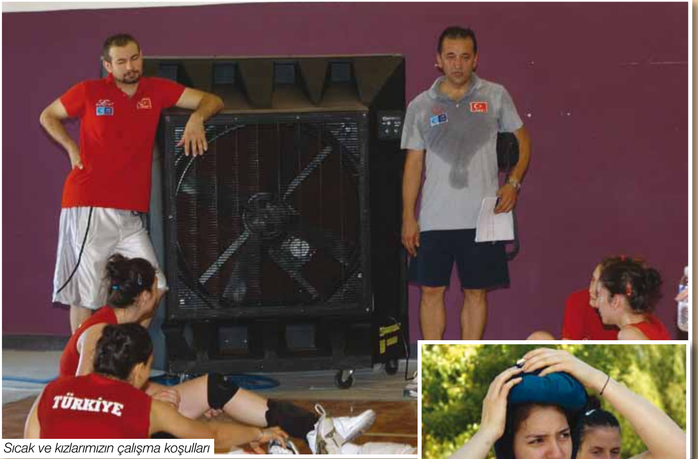
Sıcak ve kızlarımızın çalışma koşulları