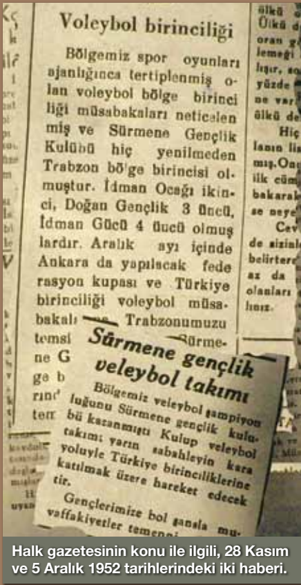
Halk gazetesinin konu ile ilgili, 28 Kasım ve 5 Aralık 1952 tarihlerindeki iki haberi.