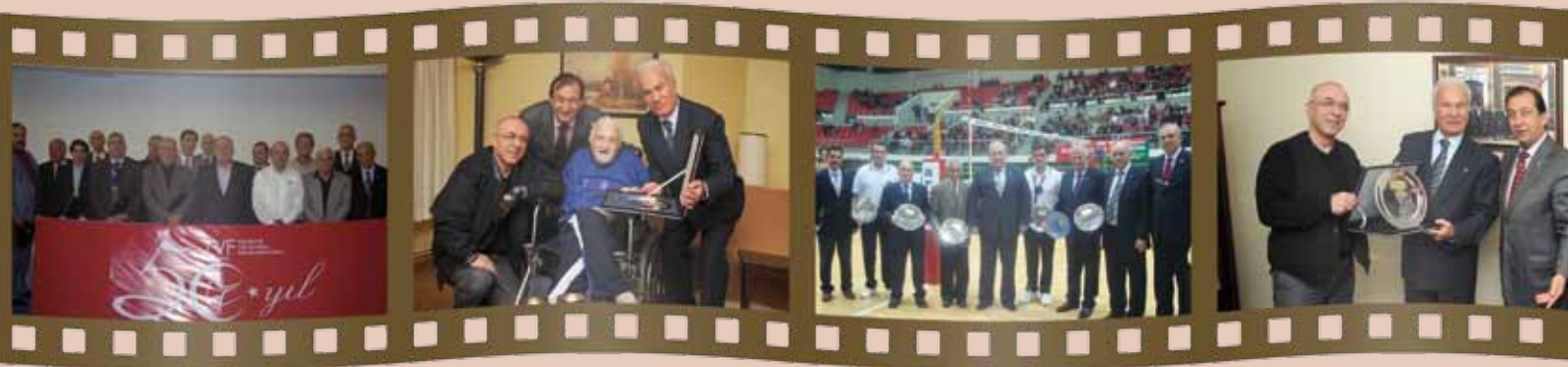
Türk Voleyboluna katkı yapanlara plaketleri İstanbul'da verildi.