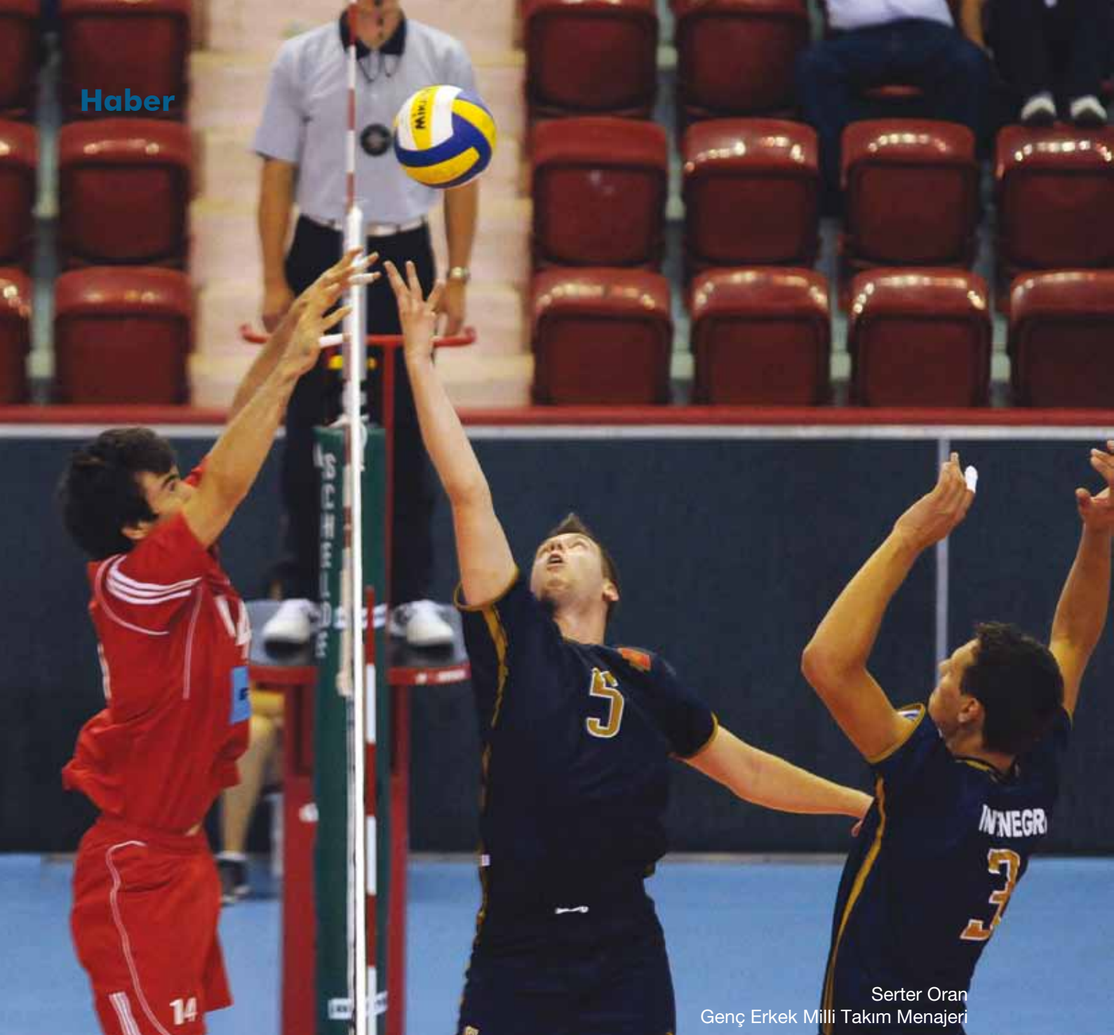
Serter Oran Genç Erkek Milli Takım Menajeri