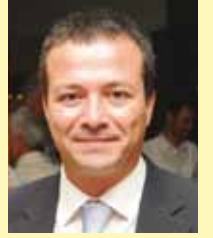
Güven GÖKTAŞ TRT Spor Spikeri