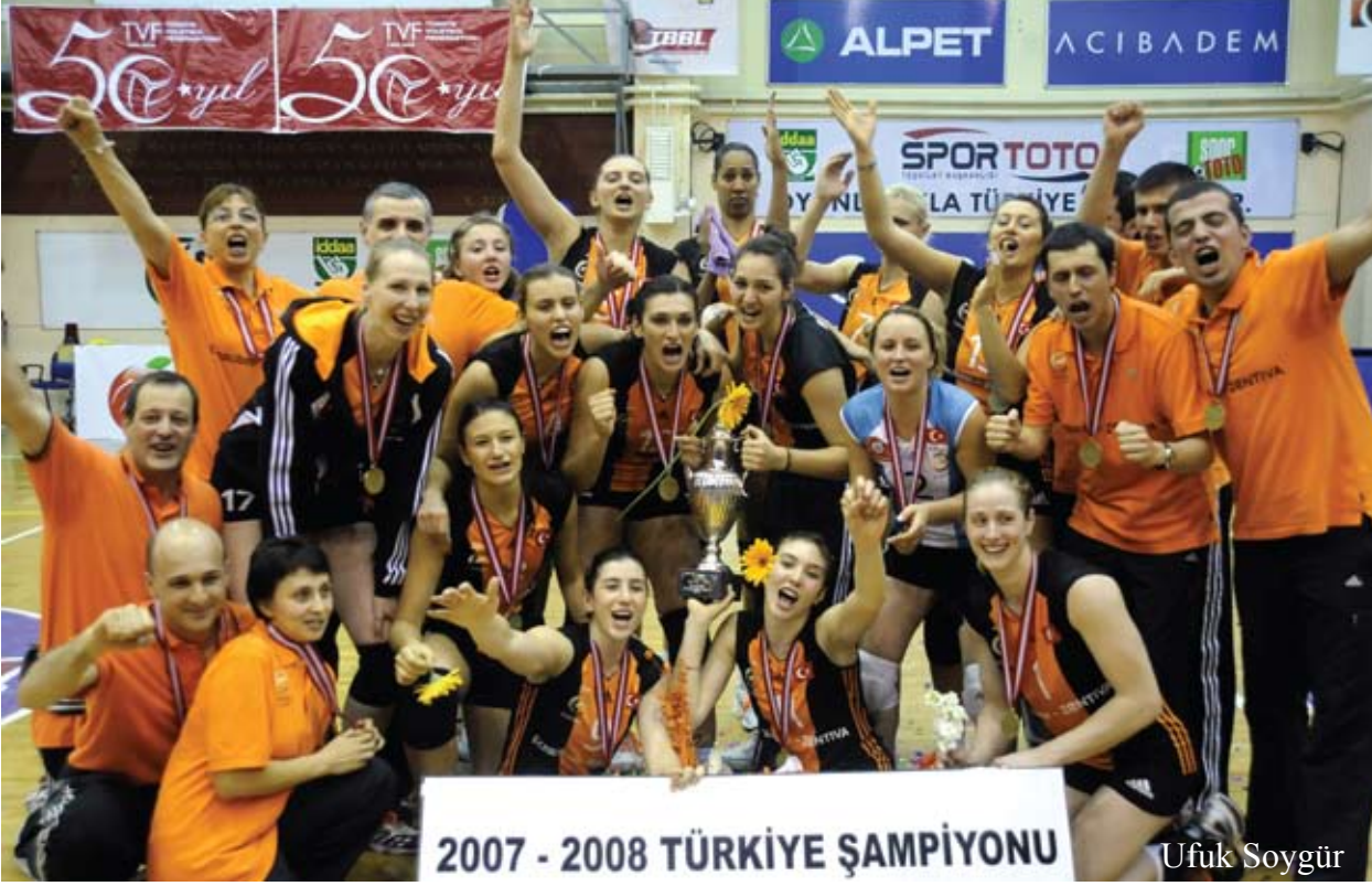
2007 - 2008 TÜRKİYE ŞAMPİYONU